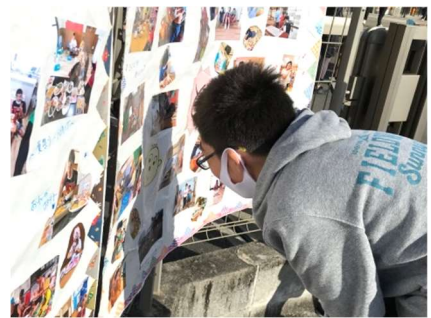
活動紹介の写真展示コーナー。「僕は写っているかな？」たくさん活動したね。

コロナ感染症対策やエコバッグ、秋祭り後のアンケート等々の御協力、ありがとうございました！秋祭りの様子は、ホームページにも掲載しますのでどうぞ御覧ください。