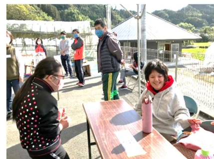
いつもの仲良し友達とも一緒に参加できて楽しさ倍増！！