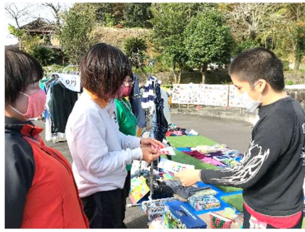
意外と大好評だったフリーマーケットコーナー…の先生にシールをもらっています。