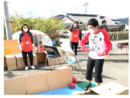
活動の成果を披露！ニュースポーツも楽しいね！写真は「ディスコン」です。