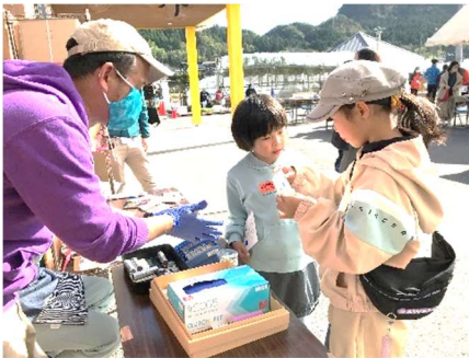
慣れている私が教えるよ！お姉ちゃんも一緒に参加してくれて楽しかった♪

当日は風の冷たさはありませんでしたが天候もよく、今年は1部・2部に分かれてゆったりとした秋祭りとなりました。たくさんの御家庭に参加いただき、大変嬉しく思いました。1部・2部に分かれての秋祭りは初めての試みで、行き届かぬ点多々あり御迷惑をお掛けしたかと思ひます。今年の反省を生かし、来年もより一層楽しい秋祭りになるように計画して参ります。