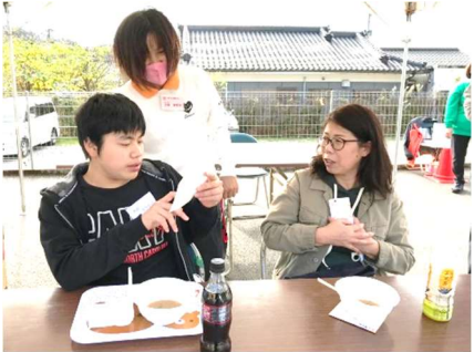
「次は誰先生にシールをもらおうかな？」スタンプラリー達成で御褒美シールゲット！