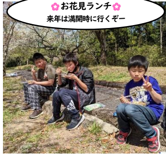
☆お花見ランチ☆ 来年は満開時に行くぞー