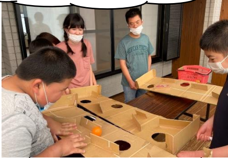
みんなで協力して、目指せゴール!