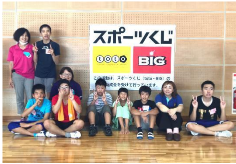
太陽の子以外の方々と一緒に♪