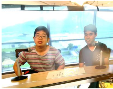
かっこよくテレビに映っているかな？