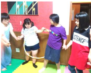
フラフープくぐり